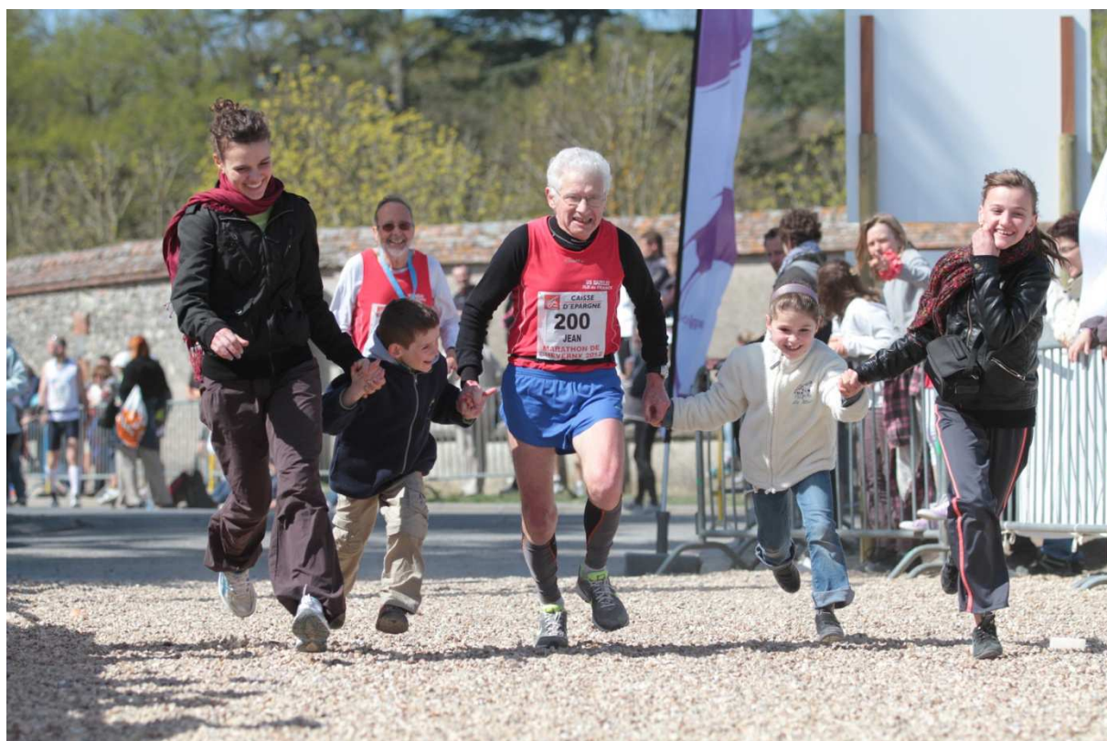
L'arrivée d'un 200 ième marathon .....bien encadré