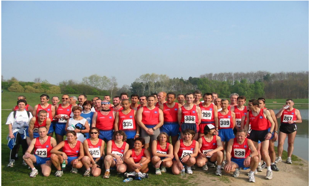
Photo du grand groupe Gazélec ..... il y a 10 ans ! ..... Du temps de notre splendeur