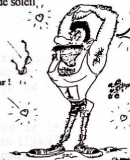
Didier superstar !

une délivrance mais aussi, beaucoup d'émotions et une grande satisfaction qui s'installe dans nos coeurs. Pour ma part, j'ai pudiquement laissé échapper quelques larmes, dissimulé par mes lunettes de soleil.